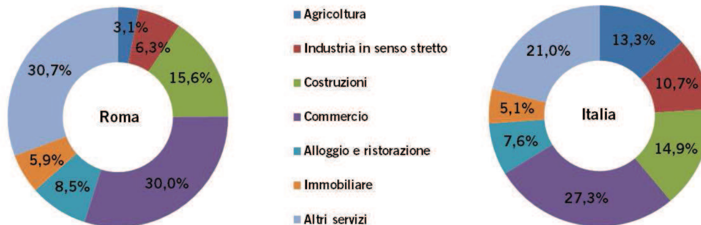
Graf. 3 – Incidenza percentuale delle imprese registrate per attività economica (ATECO2007 al netto delle imprese Non Classificate) al 31 luglio 2016