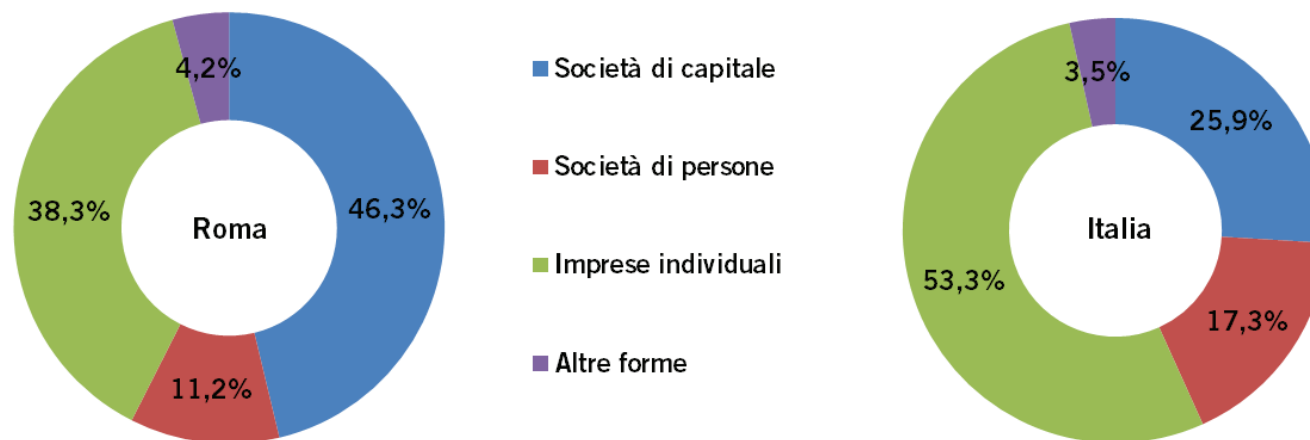
Graf. 2 – Incidenza percentuale delle imprese registrate per forma giuridica al 31 luglio 2016